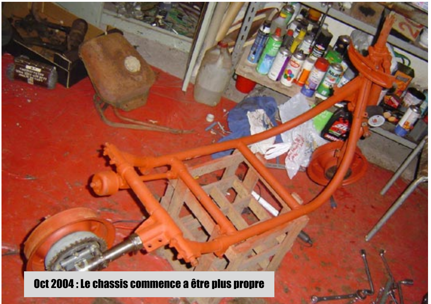
Oct 2004 : Le chassis commence a être plus propre