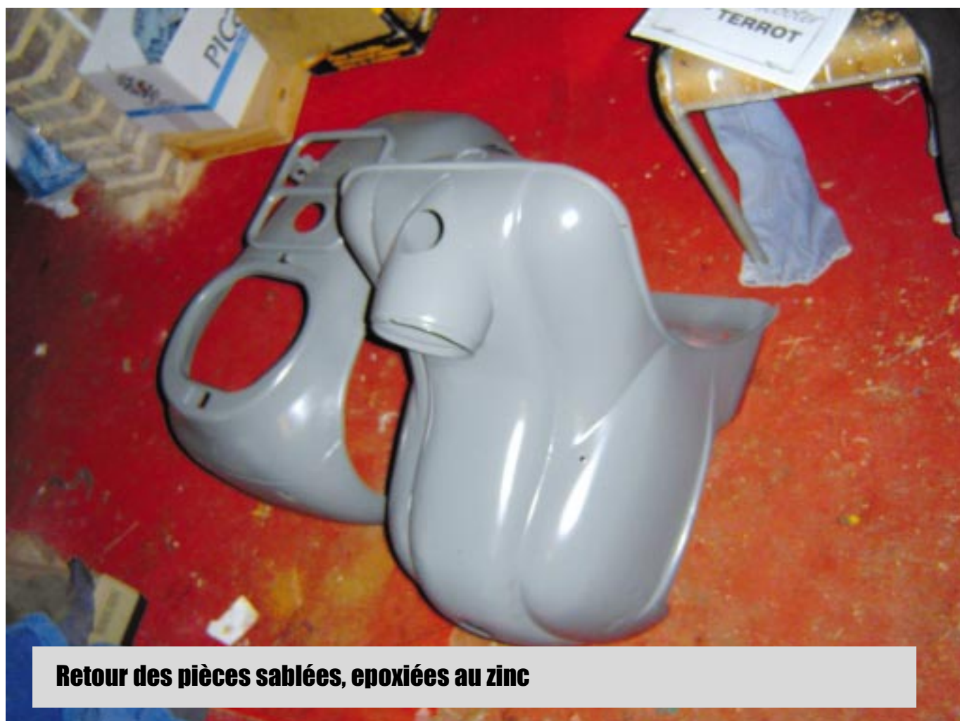
Retour des pièces sablées, époxiées au zinc