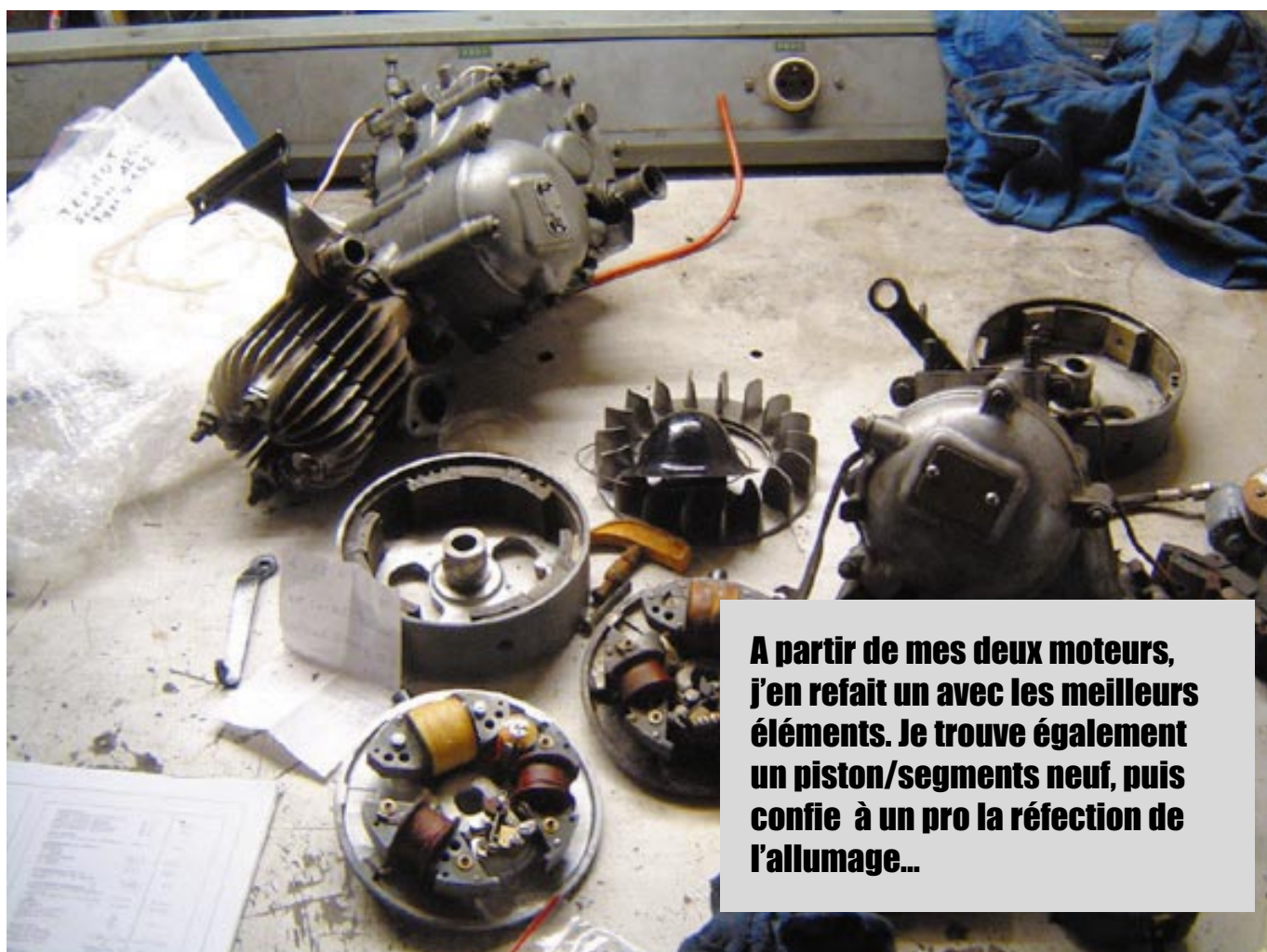
A partir de mes deux moteurs, j'en refait un avec les meilleurs éléments. Je trouve également un piston/segments neuf, puis confie à un pro la réfection de l'allumage...