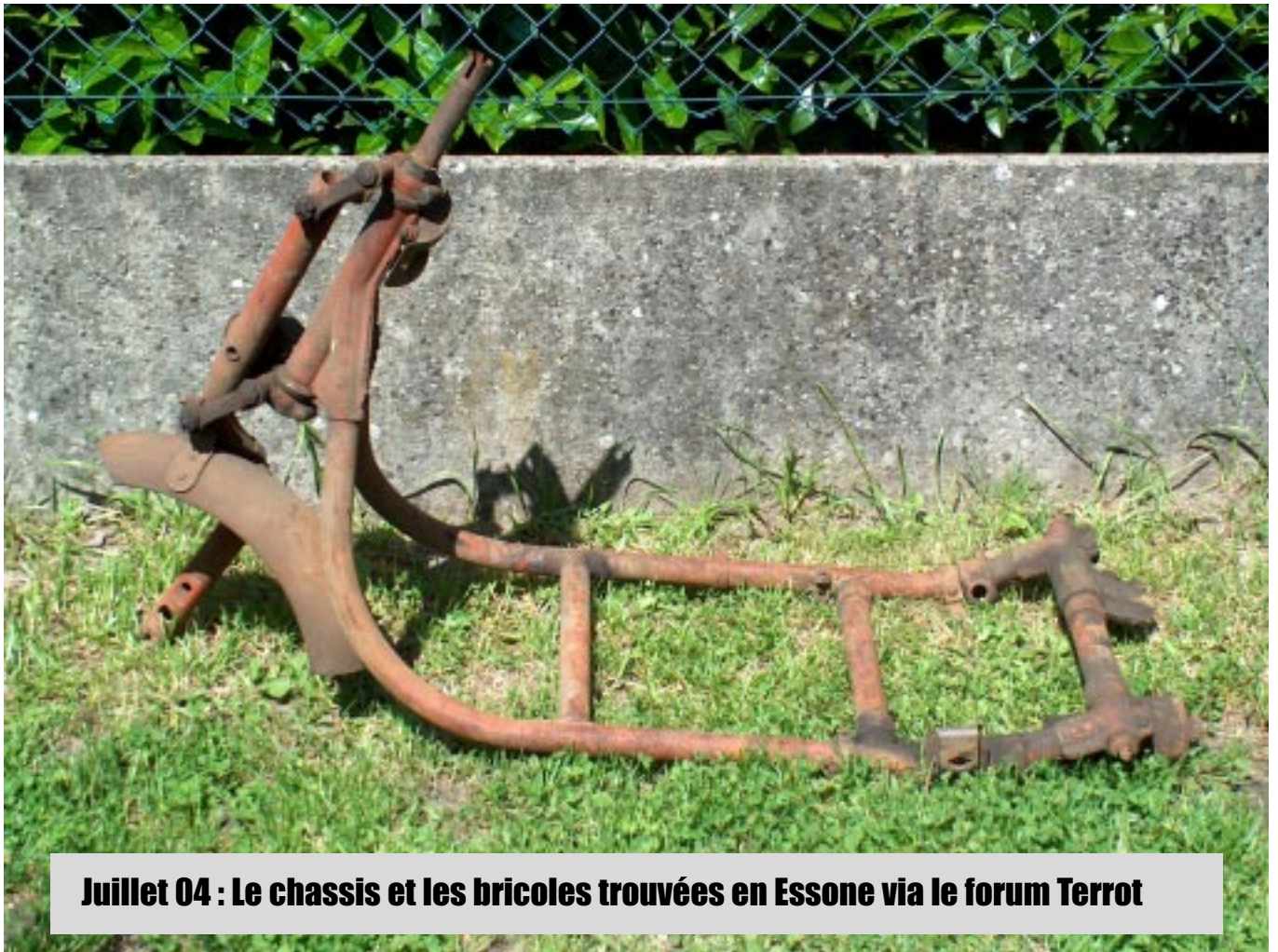
Juillet 04 : Le chassis et les bricoles trouvées en Essone via le forum Terrot