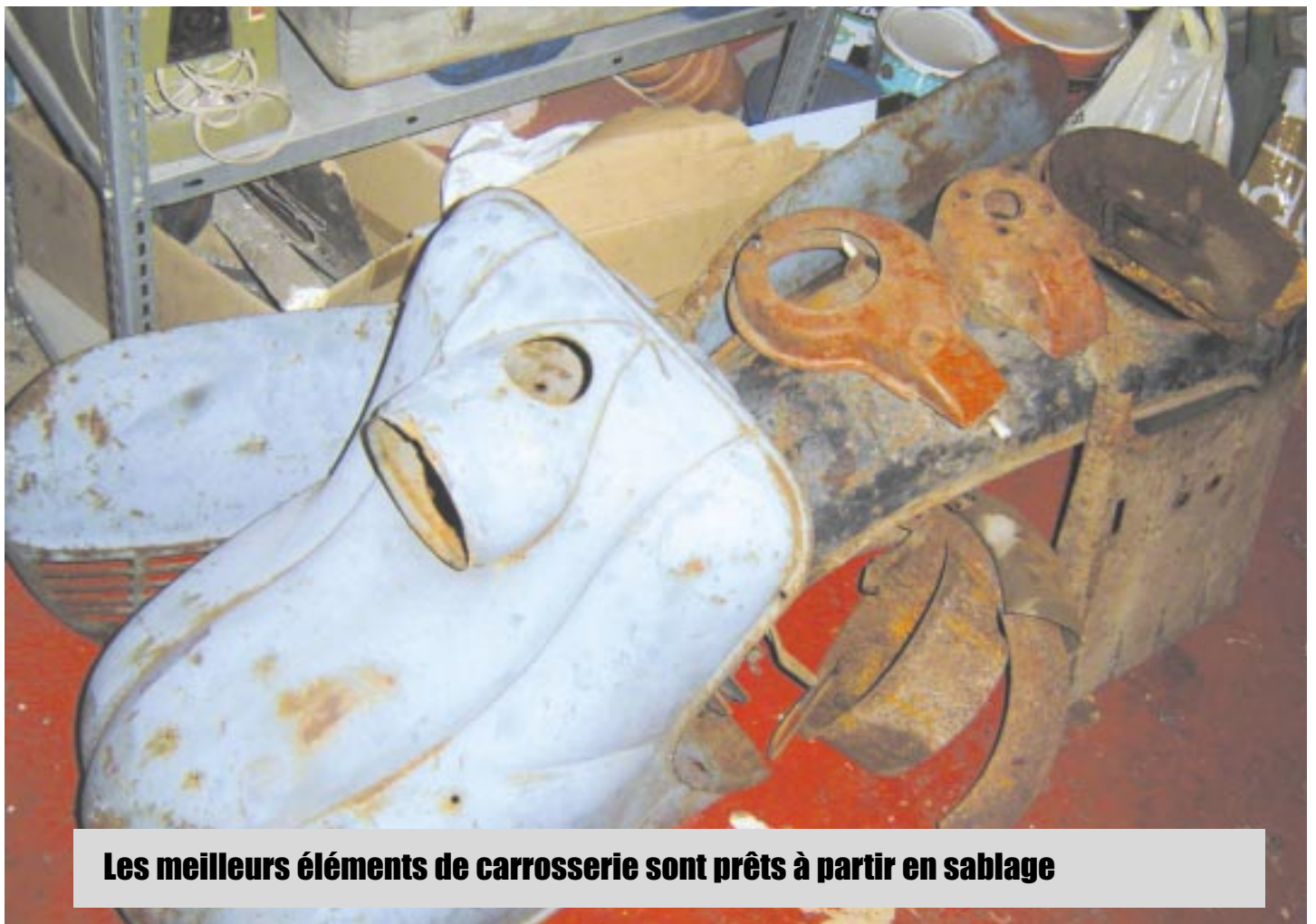
Les meilleurs éléments de carrosserie sont prêts à partir en sablage