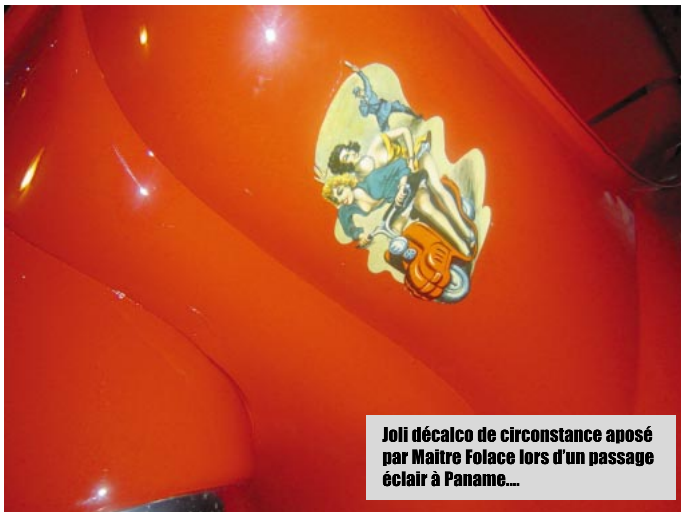
Joli décalco de circonstance aposé par Maitre Folace lors d'un passage éclair à Paname....