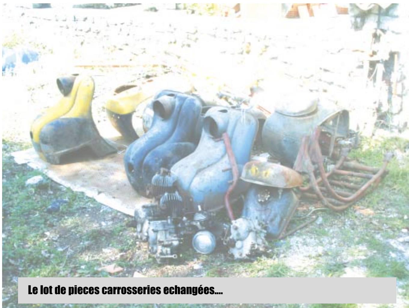
Le lot de pieces carrosseries echangées...