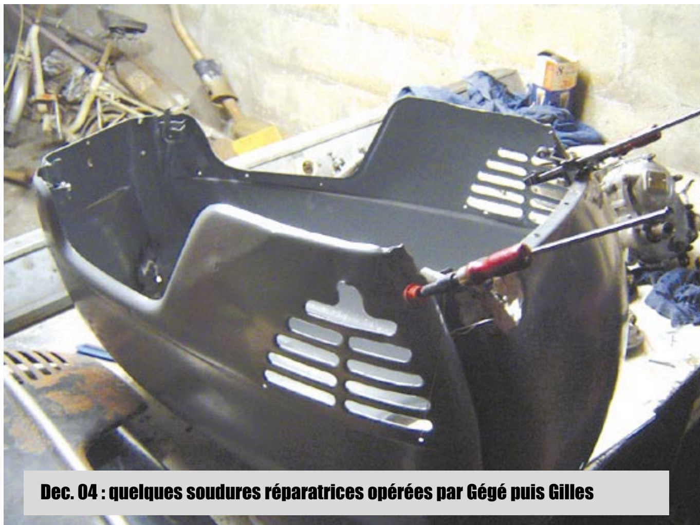
Dec. 04 : quelques soudures réparatrices opérées par Gégé puis Gilles