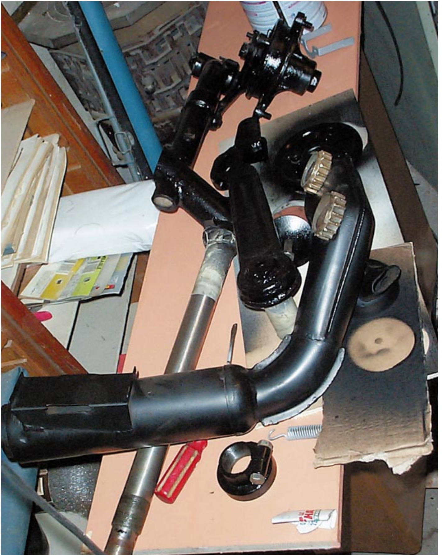
OCT : Les 1eres pieces décapées et repeintes rejoignent l'établi...